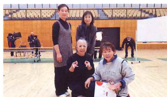
1月18日 カローリング大会