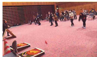
1月25日 軽スポーツ体験会