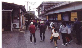
11月23日 ウォーキング大会

体育振興会主催のウォーキング大会、卓球大会、軽スポーツ体験会が開催されました。また、日硝ハイウエアアリーナで開催されたカローリング大会にて香良洲地区から出場した有志の会が市内24チームの中優勝を勝ち取りました。