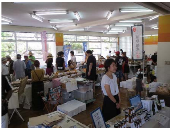
長野:みさと学校マルシェ