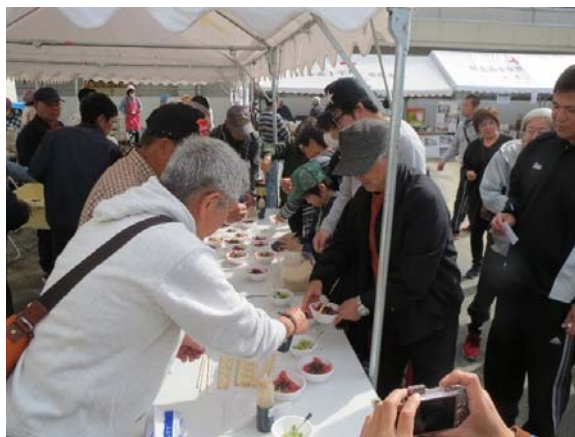
高宮:ふるさとフェスタ