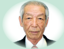
守山農業委員会会長