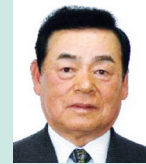
第2農地部会部会長