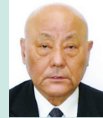
第1農地部会部会長