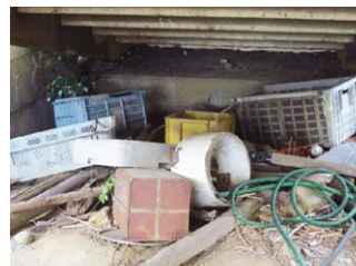
高架下に投棄されたごみ