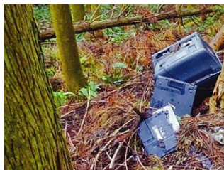
森林に投棄されたごみ