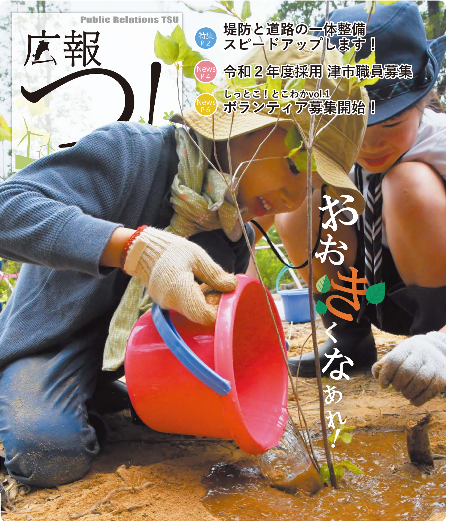
表紙 津市リサイクルセンター内自然公園の環境月間記念植樹に参加した男の子がヤマツツジの苗木に水をやりました。(6月23日)