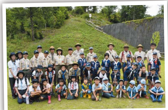
緑の中で、はいチーズ 6月23日 津市リサイクルセンター内自然公園