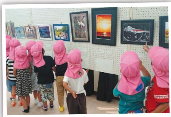
お気に入りの一枚を探せ 6月23日 コミュニティプラザ川合

防災訓練が行われ、AEDを使用した心肺蘇生訓練など地域の皆さんは熱心に聞き入っていました。