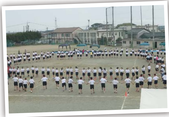
思い出に残る体育祭 6月11日 東観中学校グラウンド

ふれあいのかおり2019が開催され、市内外から約4,400人が訪れました。会場はあさりのつかみ取りやステージショーなどでにぎわいました。