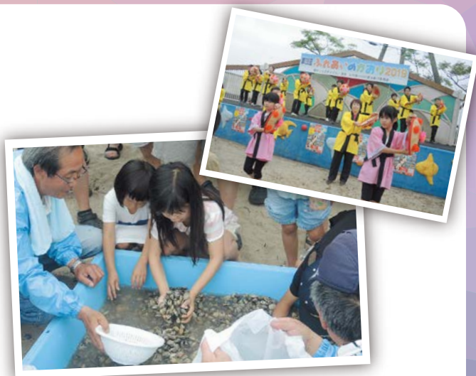
あっさり、つかめました 6月2日 香良洲公園ほか

子どもがえらぶ写真展が開催されました。一枚一枚じっくりと見て好きな作品を選びました。