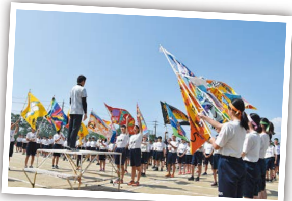
晴れ晴れ選手宣誓 6月13日 朝陽中学校グラウンド

東観中学校の体育祭が行われました。最後は全校生徒と先生と一緒にマイムマイムを踊り、笑顔いっぱいの素晴らしい1日となりました。