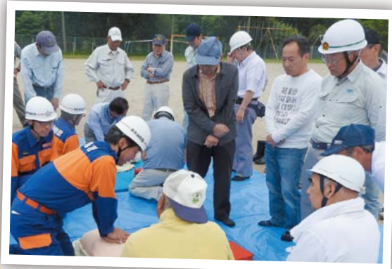
もしもの時のために 6月2日 倭小学校グラウンドほか

防災訓練が行われ、AEDを使用した心肺蘇生訓練など地域の皆さんは熱心に聞き入っていました。