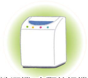
洗濯機・衣類乾燥機