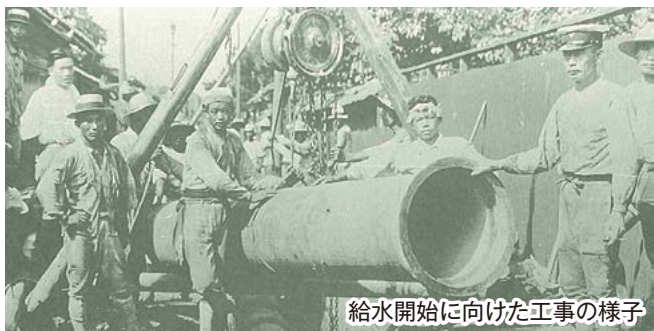
給水開始に向けた工事の様子

津市は井戸水を利用していただけ、その大部分が不衛生なものだったから伝染病が年々広がり続け、安全な飲料水の確保が重要な課題だったんだ。そこで大正14(1925)年に水道事業を創設し、当時の津市の年間予算約5年分に当たる458万円を投じて約90年前の昭和4年8月に給水を開始したんだよ。