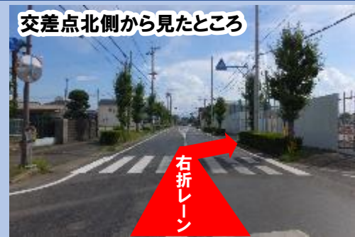
交差点北側から見たところ