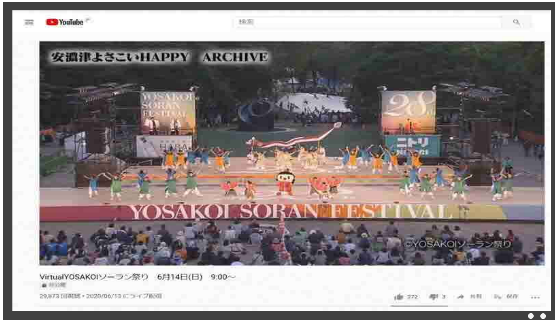
VirtualYOSAKOIソーラン祭りの様子(札幌市)