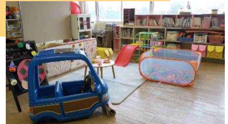
子育てサロンの様子

子どもと保護者と地域の高齢者の多世代が交流できる地域サロンの立ち上げへの取り組み