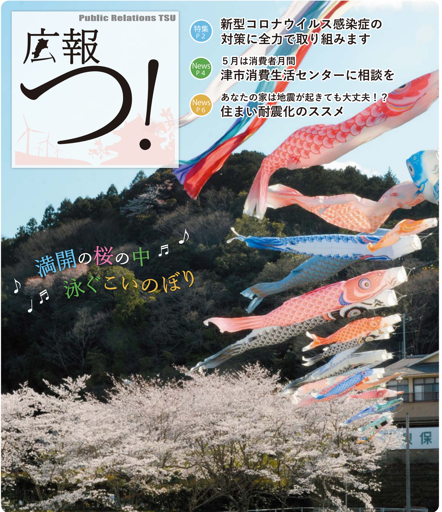
表紙 満開の桜を背に、約30匹のこいのぼりが榊原町の田園風景を彩りました。(4月4日 榊原自然の森 温泉保養館 湯の瀬周辺)