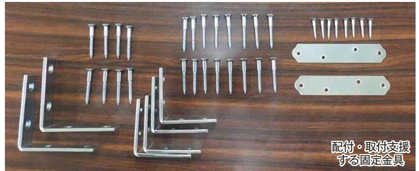
配付・取付支援する固定金具

*障がいのある人とは「身体障害者手帳の等級が1～3級」「精神障害者保健福祉手帳の等級が1級」「要介護認定の区分が3～5」「療育手帳の区分がA」のいずれかに該当する人を示します。