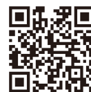
三重県ホームページ

三重県児童相談センター総務・ 家庭児童支援室(〒514-0113 一身田大古曾694-1、☎231- 5669)