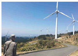
祖父が好きだった場所が、今は私のお気に入り(青山高原)