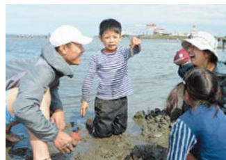
マテ貝採りで、まさに「マッテた貝があった」瞬間！(御殿場海岸)