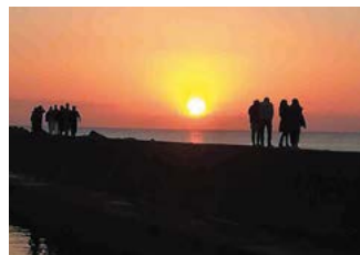
今年も家族そろって初日の出を見れました♪(白塚漁港)