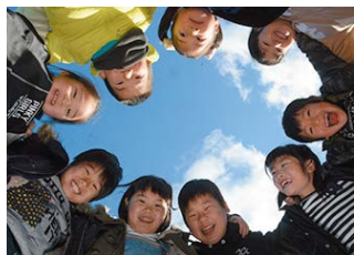
大きくなってみてもずっと友だちでいようね！(中勢グリーンパーク)