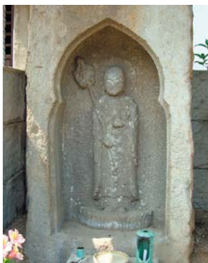
栄松寺の地蔵菩薩立像

栄松寺の地蔵菩薩は立像で、方形の凝灰岩から光背の形に彫り、厨子状になっています。その中の台座の上に立つ像高60cmほどの像は、右手に錫杖、左手に宝珠を持っています。像の左右には「正和三年甲寅八月十六日造立之」「願主沙弥滄海」と銘文が刻まれています。