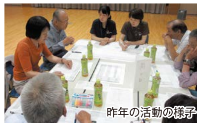
昨年の活動の様子

引きこもり防止や健康の維持・増進を図るとともに、民生委員・児童委員の皆さんの協力を得て高齢者を狙う詐欺に対する啓発活動を行っています。