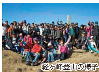
経ヶ峰登山の様子

A 地域を元気にするため、子どもたちと共に活動の輪を広げ、お年寄りがいつまでも安心して元気に暮らせる郷土づくりをとの思いでパワーズが中心となり取り組んでいます。