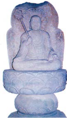
宝樹寺の地蔵菩薩坐像

宝樹寺の地蔵菩薩は右手に錫杖を、そして左手は膝の上に乘せて宝珠を持ち、右足を上に組んだ座像で、一つの砂岩から本体と光背を彫り出した総高約2mの像です。光背の左右には、「正和三年甲寅八月廿九日建立之」「願主左衛門少尉源幹重」と銘文が刻まれています。