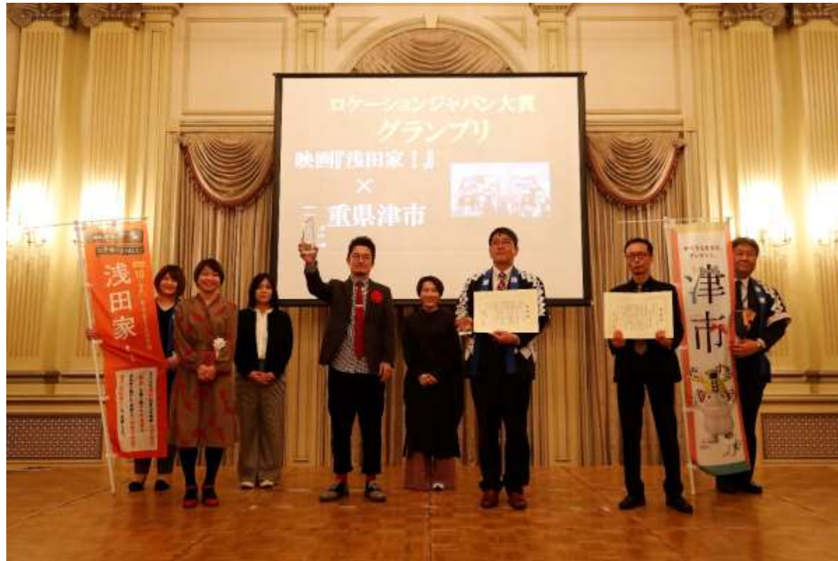
第11回 ロケーションジャパン大賞 受賞式(2月18日)

2月18日、最も地域を沸かせ、人を動かした作品と地域に贈られるロケーションジャパン大賞で「映画『浅田家！』×津市」が全30作品52地域の中から グランプリ を受賞