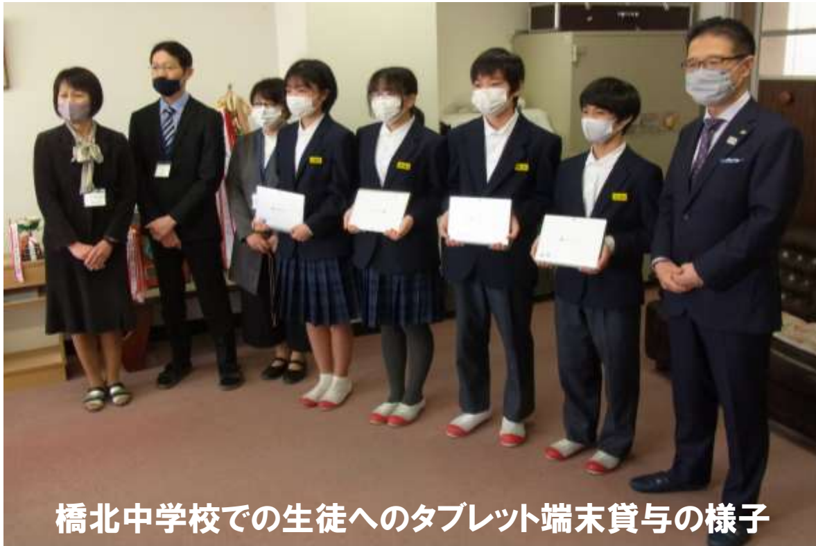
橋北中学校での生徒へのタブレット端末貸与の様子