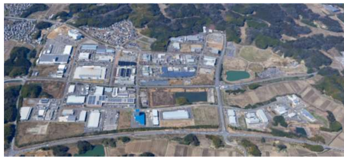
～誘致完了時のサイエンスの状況～