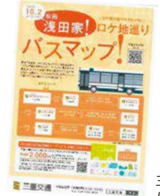
三重交通のバスマップ