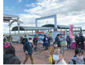
ロケ地を巡るウオークイベント

ロケ地への発着時刻などを掲載したバスマップの配布や、JR東海と連携したウオークイベント、タクシー貸し切り型ツアーなど、好みのスタイルでロケ地巡りが楽しめる♪専修寺や津の海には、例年の3~4倍の観光客が!