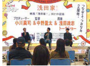
「浅田家!」大ヒット記念トークショー