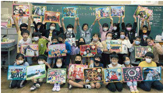
安濃小学校での出前授業