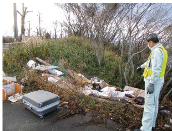
不法投棄された廃棄物