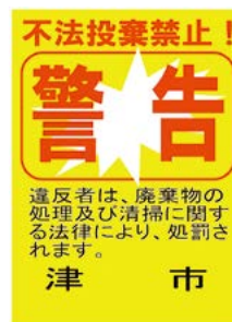
不法投棄禁止看板

指定された場所以外に廃棄物を捨てることは法律で禁止されており、「廃棄物の処理及び清掃に関する法律」により5年以下の懲役もしくは1,000万円以下(法人の場合は3億円以下)の罰金、またはその両方が科せられます。津市での不法投棄件数は近年減少傾向にあるものの、まだまだ多くの不法投棄が確認されています。巡回・監視パトロールや不法投棄禁止看板の自治会への配布などを通して不法投棄の未然防止に努めていますが、皆さんの協力が不可欠です。発見したらすぐに通報にご協力をお願いします。