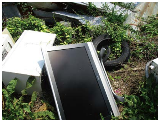
不法投棄された家電四品目

周囲や入り口にロープを張ったり、柵を作ったりするなどして車が入れないようにする。