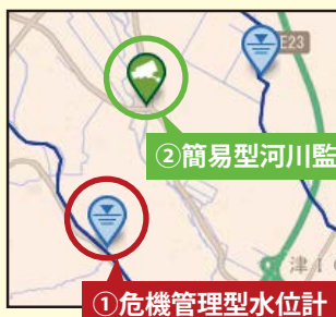
①危機管理型水位計