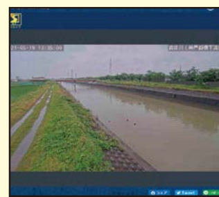
②簡易型河川監視カメラ

危険管理型水位計のアイコンをクリックすると、水位情報(水位グラフ、河川横断面図、観測値一覧)を確認できます。