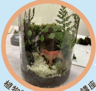
植物雑貨クリエイト講座 苔テラリウムが作れる