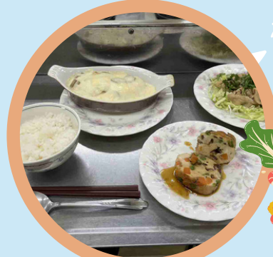
料理講座 いろんな料理が作れる