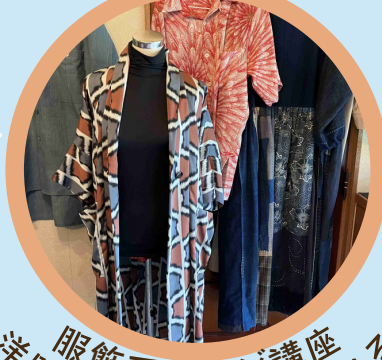
服飾アレンジ講座 洋服や帽子などが作れる