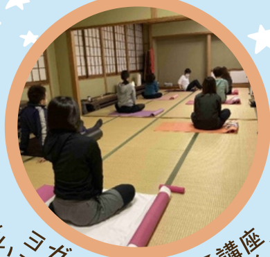
ヨガ・ピラティス講座 動いても疲れにくい体がつくれる