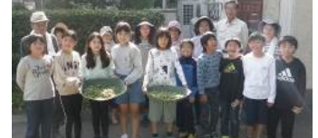
▲収穫後の笑顔(3・4年生)