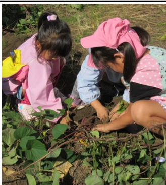
▲夢中で掘っていました