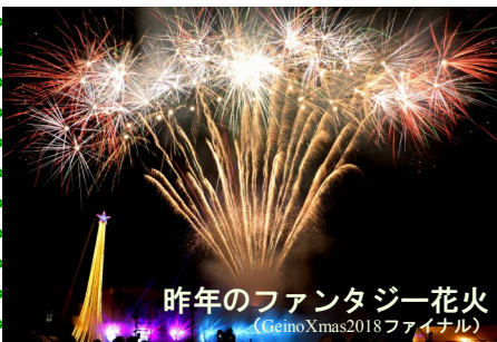
昨年ファンタジー花火 (Geino Xmas 2018 ファイナル)

また、16日(月)と17日(火)には、電飾カーが町内をパレード。18日(水)には、明幼稚園、安西・雲林院幼稚園、椋本幼稚園、芸濃保育園、げいのうわんぱーく、ミニデイ、むくの木ワークの順で訪問します。