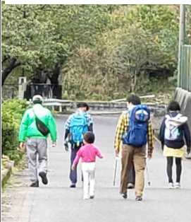
▲子どものペースに合わせてゆっくりと