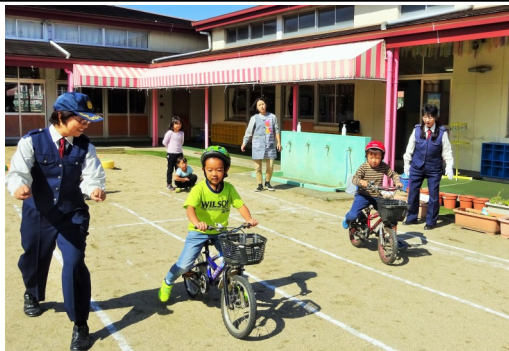
▲正しいブレーキのかけ方も教わりました

10月16日(水)、明幼稚園で、園児たちが津市交通安全教育プロバイダの方から、交通安全の大切さを教えてもらいました。一つしかない大切な命を自分で守るために、「道路の右側を歩く」、「信号を守る」、「道路にとびださない」という3つの約束をし、実際に信号機を使って、正しい横断歩道の渡り方を学びました。