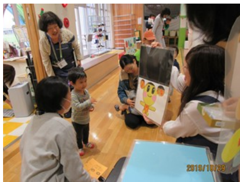
▲シルエットクイズに答える子ども

子を対象とした誕生会とおさんぽウォークラリーが行われ、37名の親子が参加しました。当日はあいにくの雨模様で、室内での開催となりましたが、子どもたちは、げいのうわんぱーくの室内を、クイズを楽しみながら歩いて回りました。ウォークラリーカードにキラキラのシールを貼ったり、ごほうびをもらったりして、どの子も笑顔でいっぱいでした。