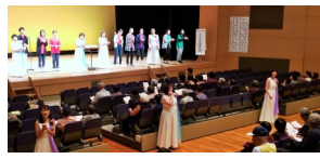
▲舞台発表の部の様子