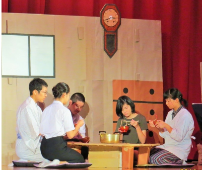
▲3年生による人権劇の披露

美術部や書道部、家庭部、PTA文化教養部が作品を展示したほか、合唱コンクール、学年発表、吹奏楽部の演奏を行い、日ごろの学習や取組の成果を精一杯発表しました。