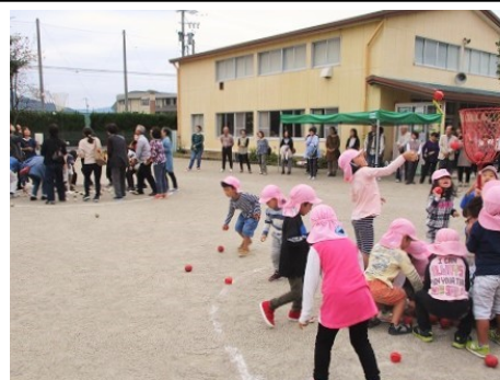
▲おじいちゃん達に勝てたかな

園で楽しんでいる遊びを一緒にしたり、運動会で踊ったりリズムを見てもらったり、玉入れをしたりして楽しい時間を過ごしました。