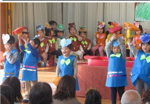
▲笑顔も元気もいっぱいの園児たち

みんなが主役の一日 12月14日(土)、芸濃保育園で幼児クラスの生活発表会が行われました。 園児たちは、観客の方の温かいまなざしの中、歌を歌ったり、劇で役を演じたりして成長した姿を披露しました。この日は、園児一人ひとりが、いつもより輝いて見えました。