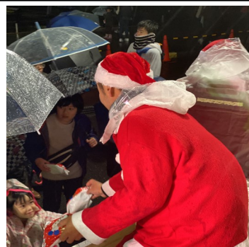
▲サンタさんからプレゼント

みんなが主役の一日 12月14日(土)、芸濃保育園で幼児クラスの生活発表会が行われました。 園児たちは、観客の方の温かいまなざしの中、歌を歌ったり、劇で役を演じたりして成長した姿を披露しました。この日は、園児一人ひとりが、いつもより輝いて見えました。