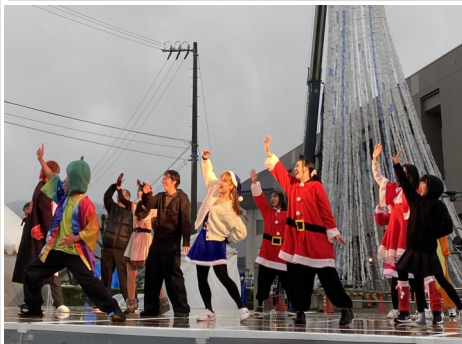
▲雨の中でも笑顔で踊ってくれました

今回初めてとなる三重高校ほか4校のダンス部によるパフォーマンスは圧巻で、観客席に立ち見客が出るほどの満員となりました。