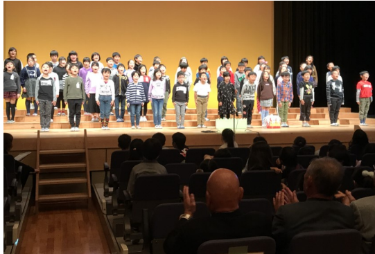
▲子どもたちの発表に拍手を送る人たち