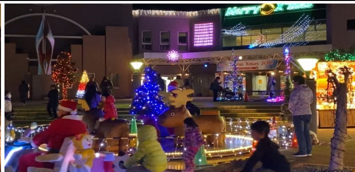
▲たくさんのLEDで彩られた総合文化センター