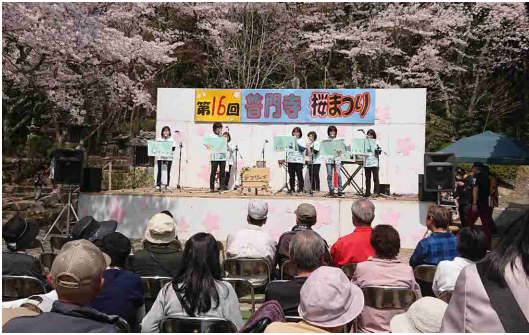
▲普門寺桜まつりでのジブリーズの演奏

普門寺桜まつりと朝市に関する活動を第一として、地元である明地区内のイベントはもちろん、芸濃町内の各種行事への参加、地域活動の視察や他団体との交流活動、小学校の行事への協力など、幅広い活動をしています。