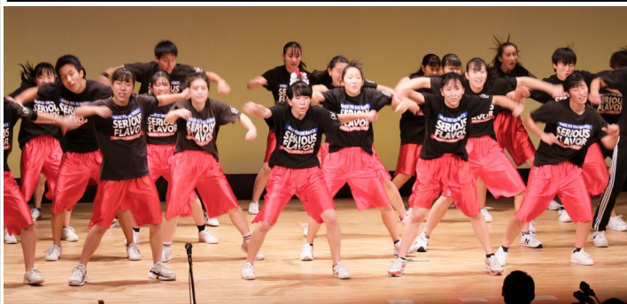
▲全国レベルの実力を持つ三重高校ダンス部