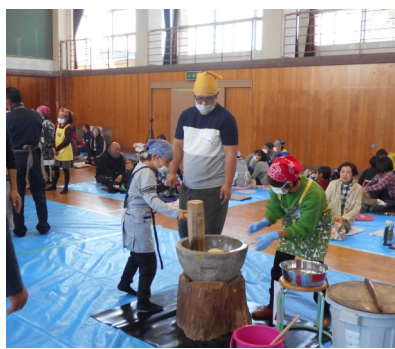
▲返しは地域の方が行いました

この日は、保護者・地域の方と子どもたちの笑顔であふれ、とても楽しい時間を共有することができました。