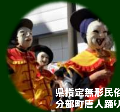
県指定無形民俗文化財 分部町唐人踊り