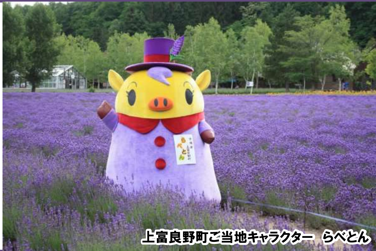
上富良野町ご当地キャラクター らべとん