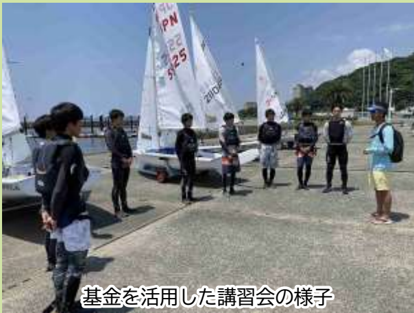
基金を活用した講習会の様子