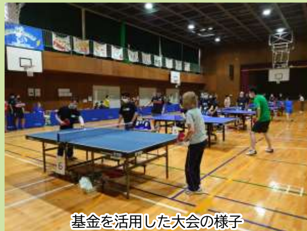
基金を活用した大会の様子