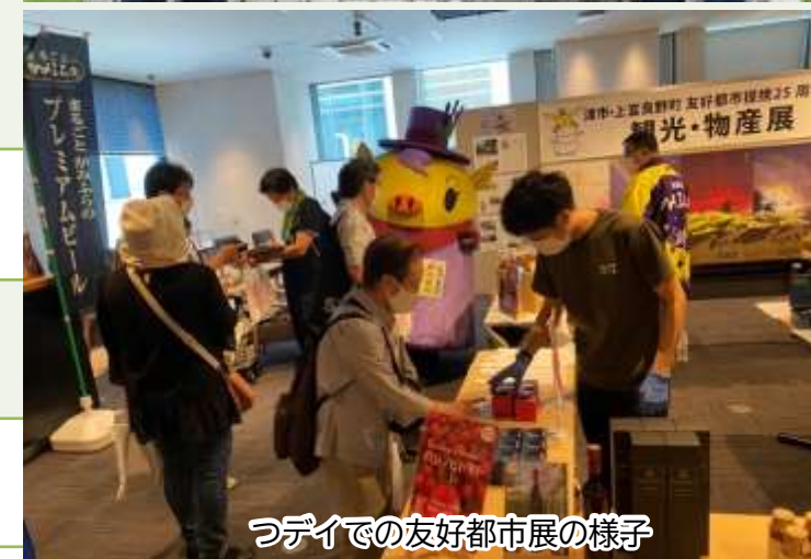
つでいで友好都市展の様子