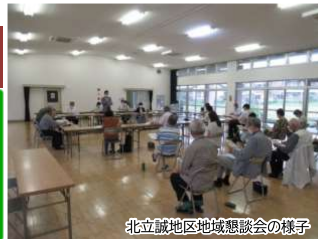
北立誠地区地域懇談会の様子