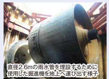
直径2.6mの雨水管を埋設するために使用した掘進機を地上へ運び出す様子

雨水幹線は、大雨の時に道路側溝などから集まった雨水を河川へ安全に放流し、街を浸水の被害から守るための重要な水路です。