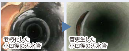
老朽化した小口径の污水管