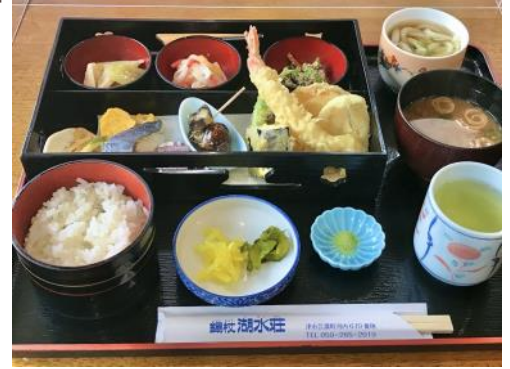
時季によって食材が変わります