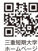
三重短期大学 ホームページ

来年3月に高校を卒業する人、働きながら学びたい人、退職後にもう一度学びたい人など、皆さんからの出願をお待ちしています。