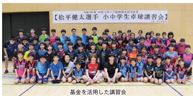
基金を活用した講習会

令和4年度から5年間にわたり集中的に競技スポーツ・パラスポーツ・生涯スポーツの振興に取り組むため、スポーツ振興基金(2億5,000万円)を創設し、スポーツ振興施策を展開。