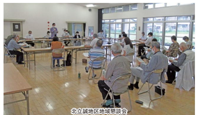
北立誠地区地域懇談会