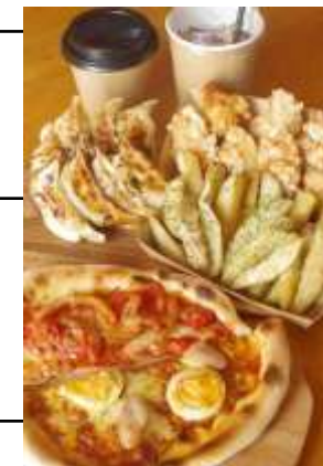
オープン記念セット イメージ