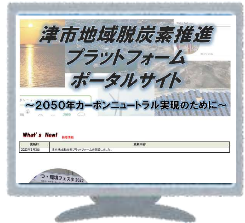
【ポータルサイトのイメージ】