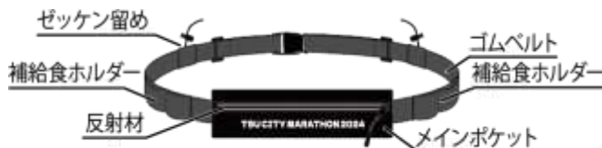
スマホも入るメインポケット