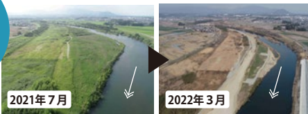
雲出川の河道掘削