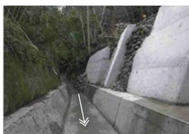
王子討谷川の護岸整備

市管理河川の護岸整備や河道掘削、下水道雨水施設の整備、ため池等の活用、森林整備などの流域治水対策を行っています。