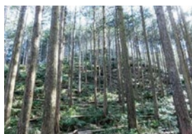
雲出川流域の森林整備