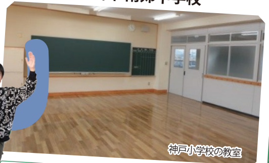
神戸小学校の教室

事業実施年度 平成18年度～令和3年度 事業費 77.0億円(校舎の大規模改造)