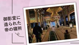
御影堂に造られた帝の寝所