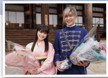
目黒蓮さんと今田美桜さん(御影堂前)

3月の映画公開を記念し、津市は映画とタイアップしたシティプロモーションを展開していきます。ぜひ大スクリーンに広がる専修寺をご覧ください!