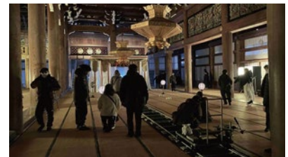
映画撮影時の様子