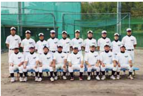
写真は2・3年生部員

一戦一戦の積み重ねです。まずは、目の前の試合に勝つことです。ここ4年間は残念ながら初戦で敗退しているので、初戦突破です。平成14年に甲子園出場の実績がありますが、指導者を含め、その当時のことを知る人は誰もいません。伝統を継承しつつ、新しい伝統は自分たちが作っていきたくたい。主将として4番も任されています。責任を持ってやっていきます。