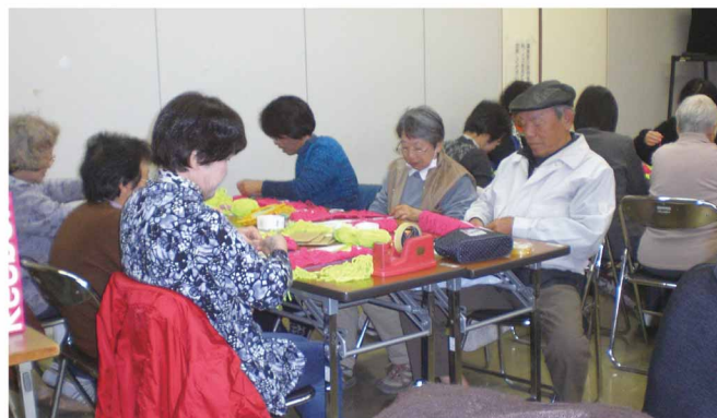
モップ作りの様子