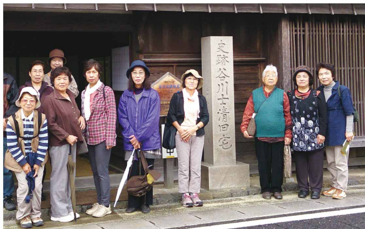
楽々ひさいの皆さん