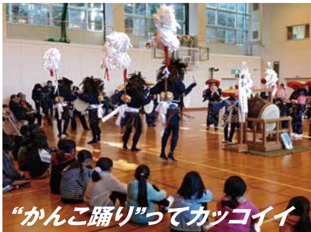
“かんこ踊り”ってカッコイイ

今年1月18日には、榊原小学校で地域学習会を開催。児童や保護者が、かんこ踊りについて学び、かんこ踊りの復活に向けて地域全体で盛り上がっています。