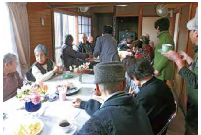
ふれあいサロン会の様子

住民が安心して楽しく暮らせる町づくり、若い世代に過重な負担をかけることなく、素晴らしい自然環境の中で安心して子育てができる多世代共生の住みやすい町づくりを目指し、活動を継続していきます。