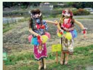
陽光苑のフラガール