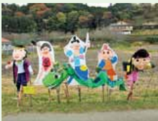
みんながヒーローズ

昨年11月の榊原温泉秋の収穫祭にあわせ、かかしコンテストが行われ、榊原自然の森温泉保養館「湯の瀬」周辺に展示されました。テーマは「おどり」です。