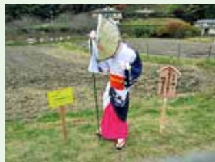
湯の里応援阿波おどり