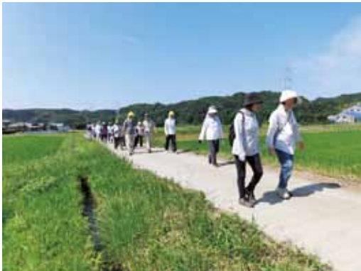
農道ウォーキング

農道の法面に芝桜を植栽したり、休耕田にひまわりやコスモスを植えて、景観を良くし、心が和む取り組みをしています。