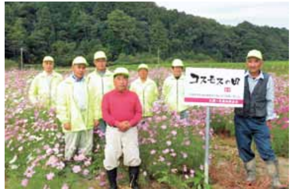
久居一色農地保全会の皆さん