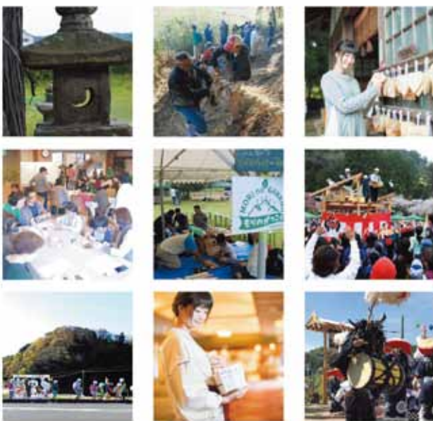
さかきばらを写そう。| さかきばらフォトコンテスト

榊原未来会議ホームページ https://www.sakakibara.club/event/