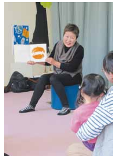
おはなしの泉の様子