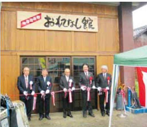
地元関係者等のテープカットによりオープンしました。

4月23日(月)、榊原町の旧消防署榊原分遣所跡をリニュー アルし、榊原温泉郷おもてなし館がオープンしました。