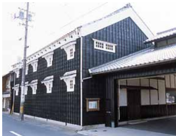
重厚な造りの酒蔵を活用した油正ホール