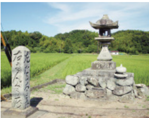
左が「茶屋の道標」、右の「常夜灯」も江戸時代のもの。