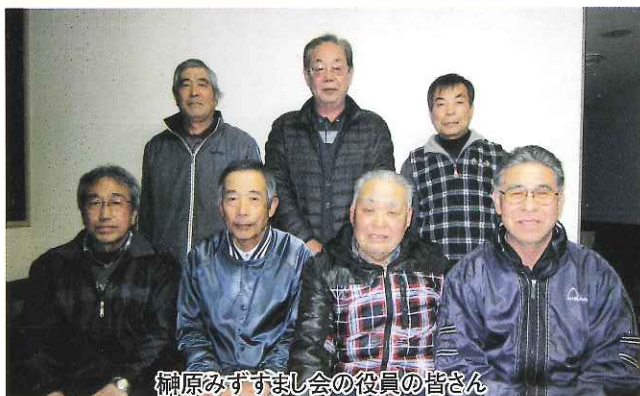
榊原みずすまし会の役員の方々