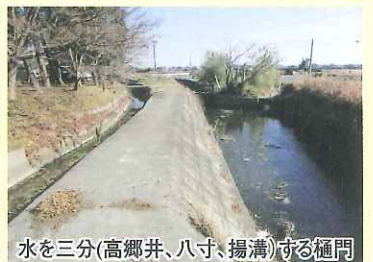
水を三分(高郷井、八寸、揚溝)する樋門

用水路は、その後何度か補修され、昭和35年には、雲出井頭首工が完成し、総延長100km余り、約800haの水田が潤うようになりました。