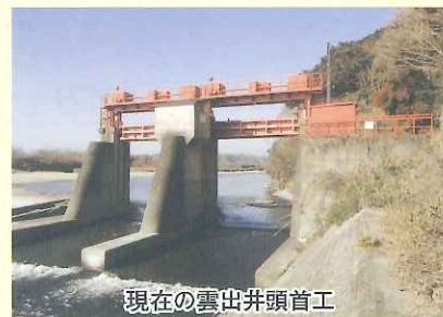
現在の雲出井頭首工

完成当時の雲出井用水は、現在の雲出井頭首工(戸木町善応寺)辺りから雲出川の水を引き入れ、久居中学校の南裏手、元町、新家町、木造町などを通り、高茶屋で水を三分(高郷井、八寸、揚溝)して高茶屋・雲出地区に至る延長約13kmの用水路で、約600haの田畑がその恵みを受け、1万石近くの収穫の農地が潤うことになりました。