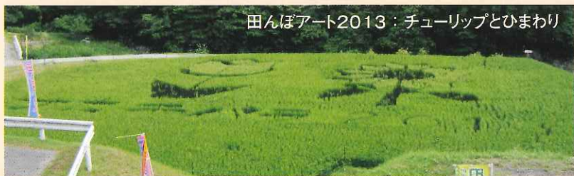
田んぼアート2013：チューリップとひまわり

5年目を迎える榊原温泉 田んぼアートでは、今年も田植えの参加者を募集します。開催日は6月上旬の日曜日を予定しています。