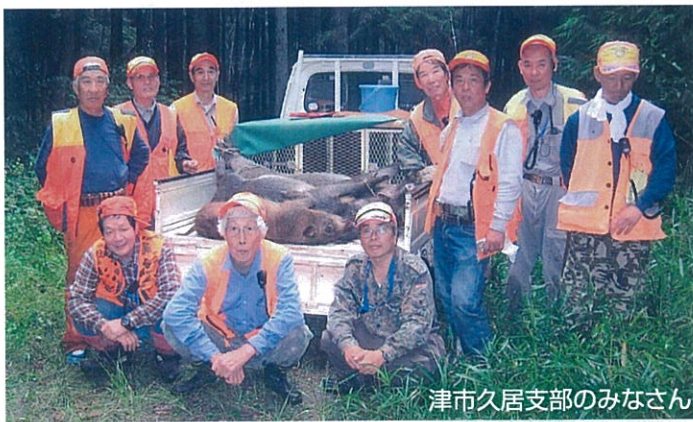
津市久居支部のみなさん

担当地区の久居西部は、山間部に農地が広がっていて大変ですが、事故のないよう安全を第一に活動しています。活動内容は津市久居支部の方と同様ですが、当支部内には地域住民で構成する獣害対策協議会があり、その活動にも協力しています。最近も、新型の罠であるドロップネットの運用に参加して捕獲の成果を上げています。自分たちの活動で地域の獣害が少しでも減ってくれば嬉しいです。