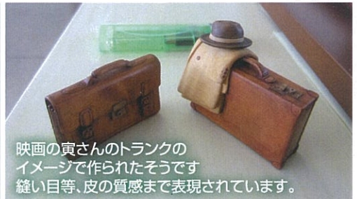
映画の寅さんのトランクの イメージで作られたそうです 縫い目等、皮の質感まで表現されています。