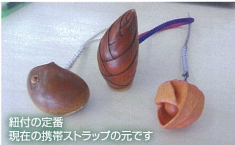
紐付の定番 現在の携帯ストラップの元です

昔から定番で掘られているもの以外にも、旅行用トランクや楽器、革靴など身近なものも対象にして