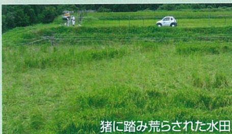
猪に踏み荒らされた水田

津市では、獣害対策として個体数の調整、防護柵の設置推進、地域ぐるみの取組支援を三本柱として取り組んでいます。