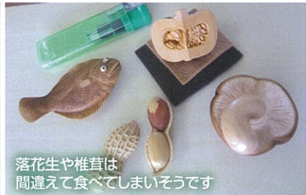
落花生や椎茸は 間違えて食べてしまいそうです