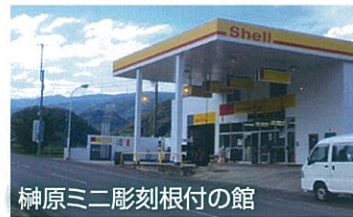
榊原三彫刻根付の館

作品が思うように仕上がった時の嬉しさは何とも言えません。また、見に来られたお客さんに感動してもらえることが喜びです。