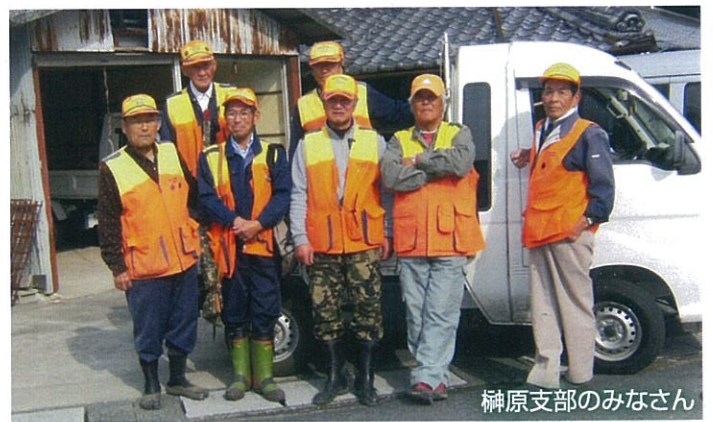
榊原支部のみなさん