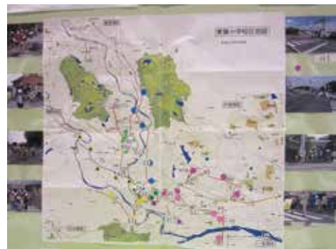
通学コース地図を地区文化祭で展示

栗葉小学校区はとても広く、通学コースも主に7グループに分かれています。会員だけでなく、地域の皆さんにも通学路を知ってもらおうと、地区の文化祭で通学コースの展示をしました。地域全体で子どもたちを見守っていけたら、と思います。