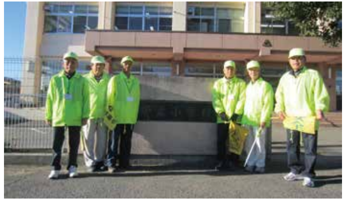
栗葉小学校前で活動している皆さん