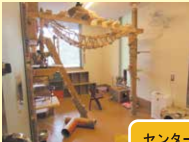
センター内は自由に見学できます。