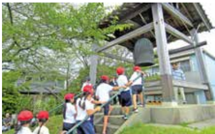
子どもたちの鐘つき体験の様子

時の記念日には、誠之小学校3年生の子どもたちを招待して、鐘つき体験をしてもらっています。大晦日は、近隣の人が除夜の鐘をつきにたくさん来られますので、鐘堂の横でかがり火をたいてお迎えしています。