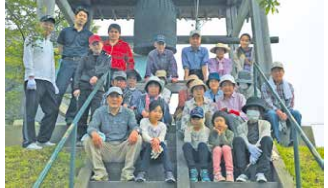
清掃活動に集まった自治会の皆さん

久居 さやまち 幸町にある津市有形文化財「子午の鐘」 と き 。江戸時代の元文元年(1736年)に久居城下に時を知らせるために作られ、寛政元年(1789年)に現在の位置に移されました。その後、太平洋戦争期に陸軍へ供出されたり、伊勢湾台風では鐘堂とともに鐘が落下するなど、数々の危機を乗り越えてきましたが、現在は地域の人たちの手で守られています。