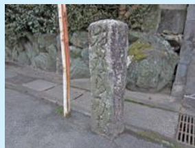
牧町に残る道標 「右ならみち、左さんごうみち」 と刻まれています。