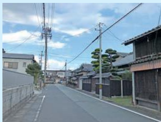
当時は宿屋が建ち並んだ旅籠町

美里町五百野で「伊賀街道」から分かれて月本追分(松阪市)で「伊勢街道」に合流する区間は、古くから「伊賀越え奈良道」、「奈良道」と呼ばれ、後に「奈良街道」と呼ばれました。この街道は京都・大阪方面から伊勢神宮をめざす人々が往来し、文政13(1830)年のおかげ参りの際は、10万人余りの旅人が城下を往来したと言われています。