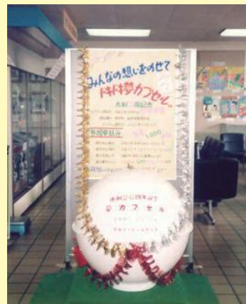
30年前の一般公募の様子

埋設したタイムカプセル2基のうち1基が浸水しており、約半数の200名分が腐食し確認できない状態です。埋設当時も細心の注意をもって対応したと思いますが、このような事態になりましたこと残念に思っております。何卒、不測の事態とご理解いただきまして、ご了承下さい。(久居ライオンズクラブ)