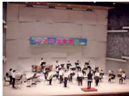
久居西中学校吹奏楽部の演奏

開催当日は入念な消毒作業や、出演者同士の密の回避に注意を払うなど、慣れない会場での手探りの運営で苦労が絶えなかったとの声もありましたが、次回開催につながる有意義な経験となったようです。