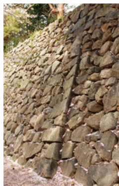
石垣の継ぎ足し部分

また、本丸南側には古い石垣の隅に石垣を継ぎ足したような痕跡を見ることができます。ここから東側に約30mを拡張したことがはっきりと確認できる場所ので、本丸は東西・南北とも一辺が100mを越えるものとなりました。