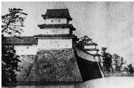
北東方向から撮影した本丸(明治初期)

まず、津城の顔となっているのが本丸北側の石垣です。ここには、北東隅の丑寅櫓 うしとらやぐら と北西隅の戌亥櫓 いぬい 、そして両櫓をつなぐ多門櫓が建てられました。これらは高虎により新設されたもので、石垣の直線的な稜線が彼の築城術の特徴を示しており、その姿は明治初期に撮影された写