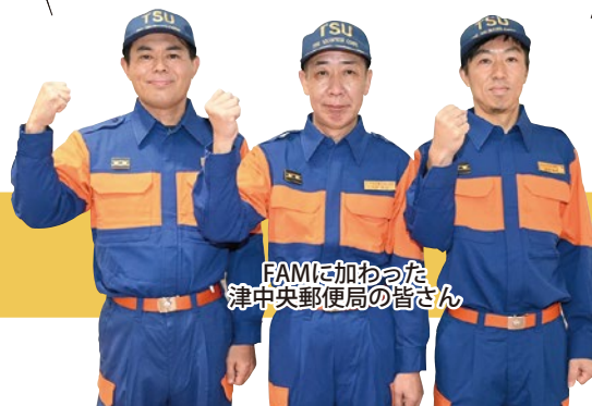
FAMに加わった津中央郵便局の皆さん

少しでも多くの人命救助等に携わりたいです。FAMに入団する事業所が増えることを期待しています!