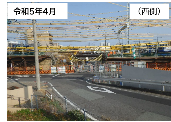
作業用構台設置状況

1月に東西両側の作業用構台の設置作業が完了しました。 2月から線路の仮橋設置工に着手 ※仮橋の橋台・橋脚設置(鋼管杭打設)