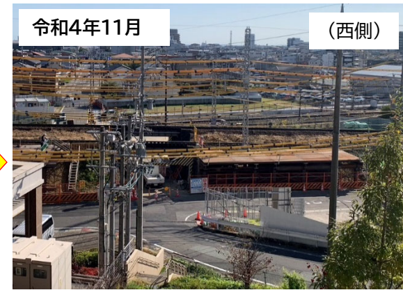
作業用構台設置状況