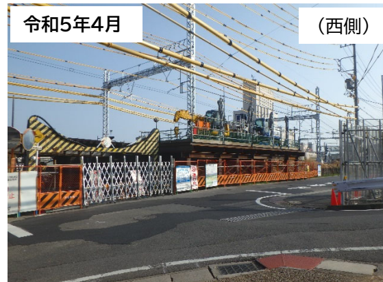
作業用構台設置状況