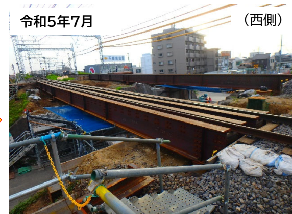
近鉄架道橋 仮桁設置作業