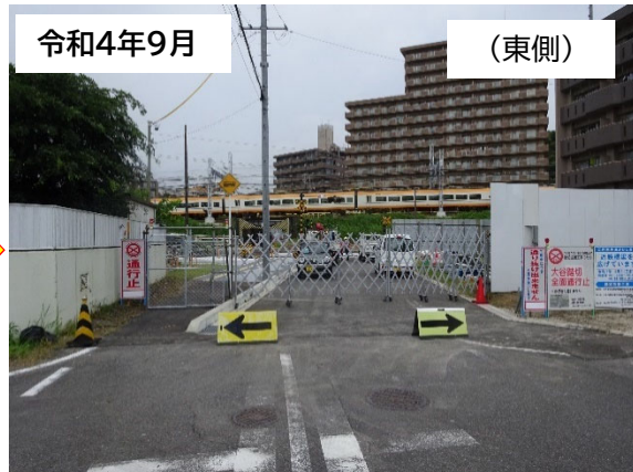
近鉄架道橋 本体工事に着手