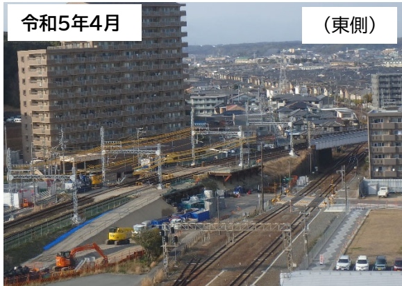
作業用構台設置状況