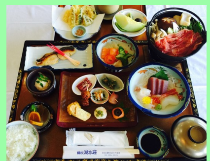
季節によって料理の内容が異なる場合があります