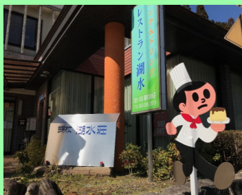
プリンを持つ飛び出しくん